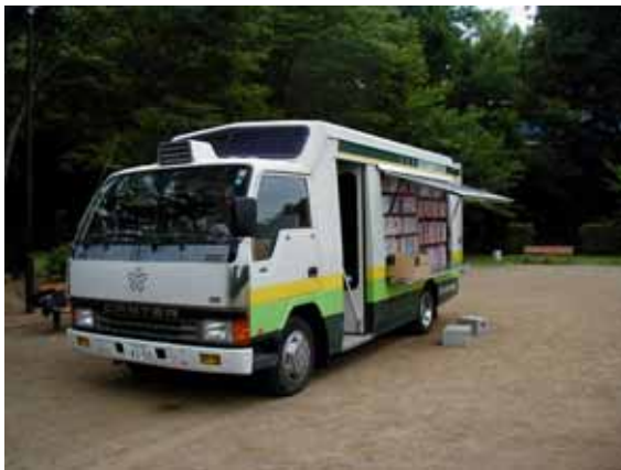
移動図書館車 さくらおぐるま号

移動図書館車(さくらおぐるま号)の運行によって、図書館から離れた地域に設けられたステーションや学校において、定期的に図書の貸出をします。