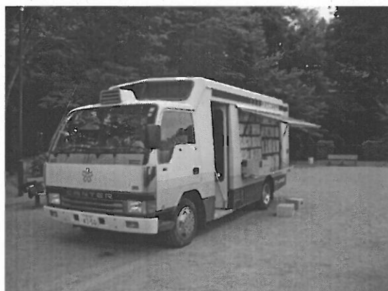
移動図書館車 さくらおぐるま号

移動図書館車(さくらおぐるま号)の運行によって、図書館から離れた地域に設けられたステーションや学校において、定期的に図書の貸出をします。