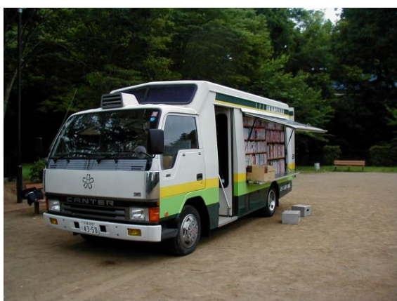
移動図書館車 さくらおぐるま号

移動図書館車(さくらおぐるま号)の運行によって、図書館から離れた地域に設けられたステーションや学校において、定期的に図書の貸出をします。